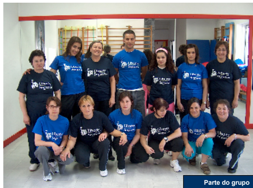
Parte do grupo

A Obra Social não é indiferente a isso e começou a proporcionar às suas trabalhadoras e outros elementos dos órgãos sociais, uma aula de ginástica / dança com o professor Marco, uma vez por semana. Esta também é uma forma de combater o sedentarismo.